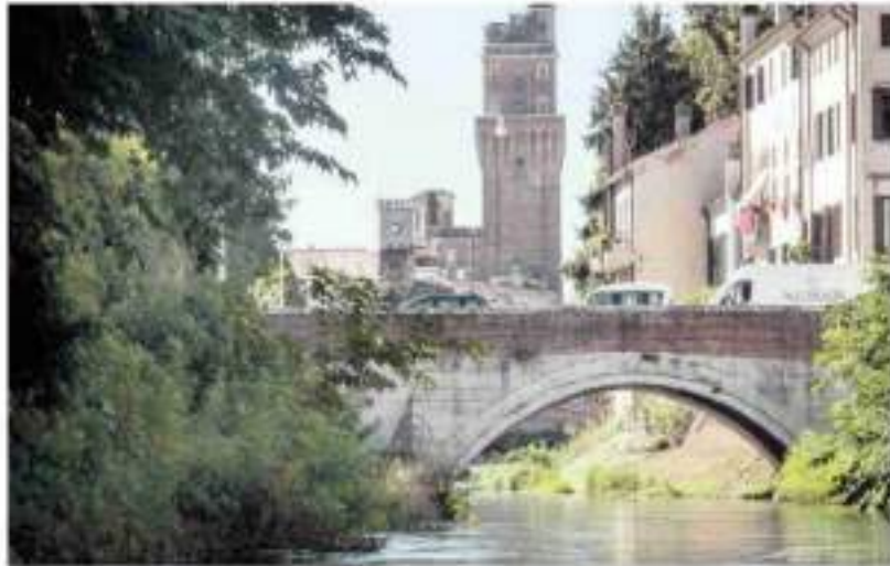
DA SINISTRA: Ritorno Itaca è il festival del turismo sostenibile che invita a una prospettiva turistica diversa, come la gita sul fiume