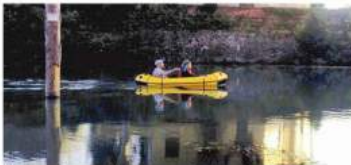
Un'assonanza a pari d'acqua per scoprire la bellezza che un nuovo punto di vista può dare anche fuori dalla porta di casa