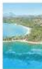
Cala di Stabia (Napoli)