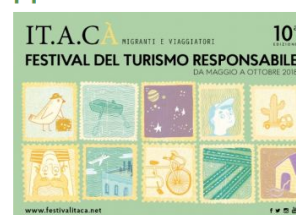
La cartolina del festival