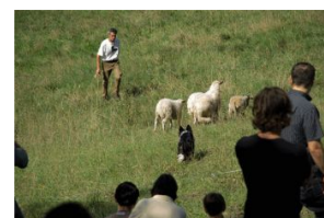
La pecora e il lupo